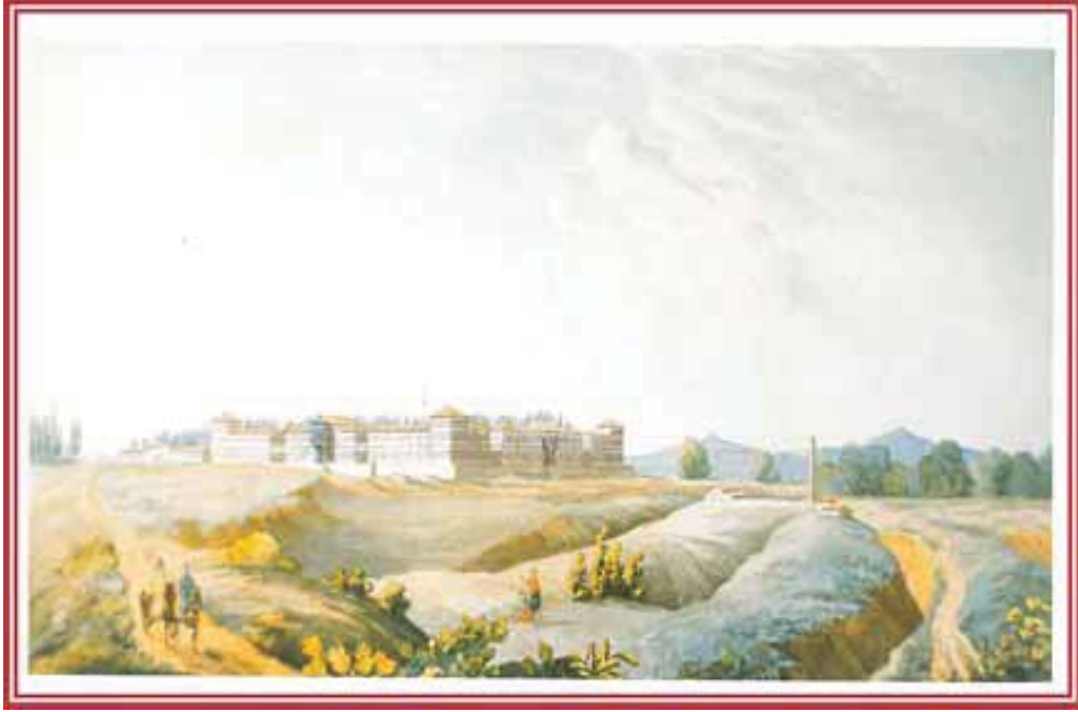
Carl Gustaf Löwenhielm'in fırçasından 1820'lerde Taksim Topçu Kışlası.

Mükemmellik ve hak ettiği şekilde ifade etmek için binanın tek eksiği dış görünüşüdür” 30