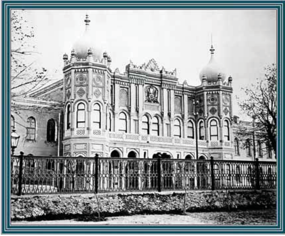
Taksim Topçu Kışlası'nın Anıtsal Girişi.

bu şenliklerin birinci gününde Babîâli, ikinci gününde Bâbıseraskerî, üçüncü gününde ise Taksim Topçu Kışlası'ndaki ziyafete katılarak buraya verdiği önemi göstermiştir. 70 Beyoğlu Kışla-i Hümayunu'nu Sultan II. Abdülhamid de ziyaret etmiştir, padişahın 2 Nisan 1893'te kışlayı ziyaret etme kararı alması üzerine, süratle bir takım tamirat işlerine girişilmiş ve çevresi düzenlenmiştir. 71