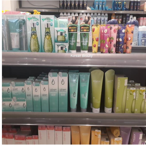
Foto 1. Güney Kore kozmetik ürünleri

“...Evet mağazalarına gidiyorum. Mumuso, Miniso. Doğu Asya ürünleri. Kore, Japon, Çin olsun bunları alıyorum. Ama spesifik Kore olsa bir yer oraya da net giderim. Alıyoruz, takip ediyoruz yeni ürün gelmiş mi bakıyoruz. Kore malı olması yeterli. Kıyafet, çanta, makyaj süngeri, askılık alıyorum. Maskelerini alırım. Maskelerin çoğu Kore’ye ait zaten. Orada ne varsa hepsini kullanmaya çalışıyorum. Sebebi de daha renkli ve daha kullanışlı olduğunu düşünüyorum ve daha göz zevkime uygun...”