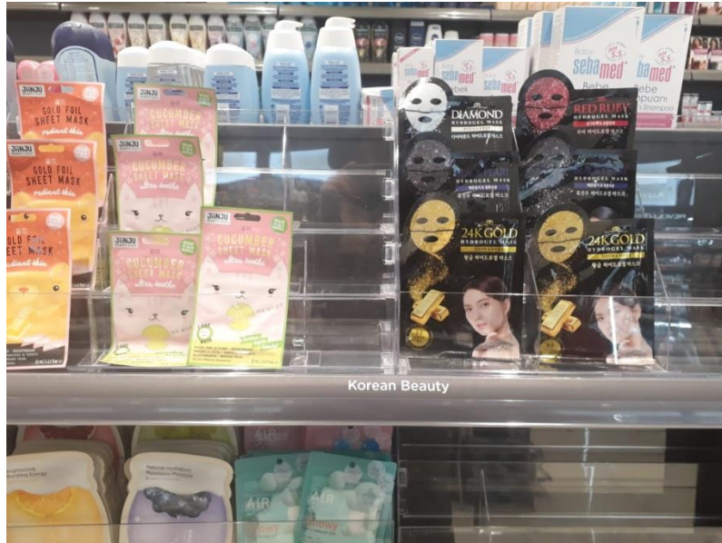
Foto 3. Güney Kore ürünü cilt bakım maskeleri